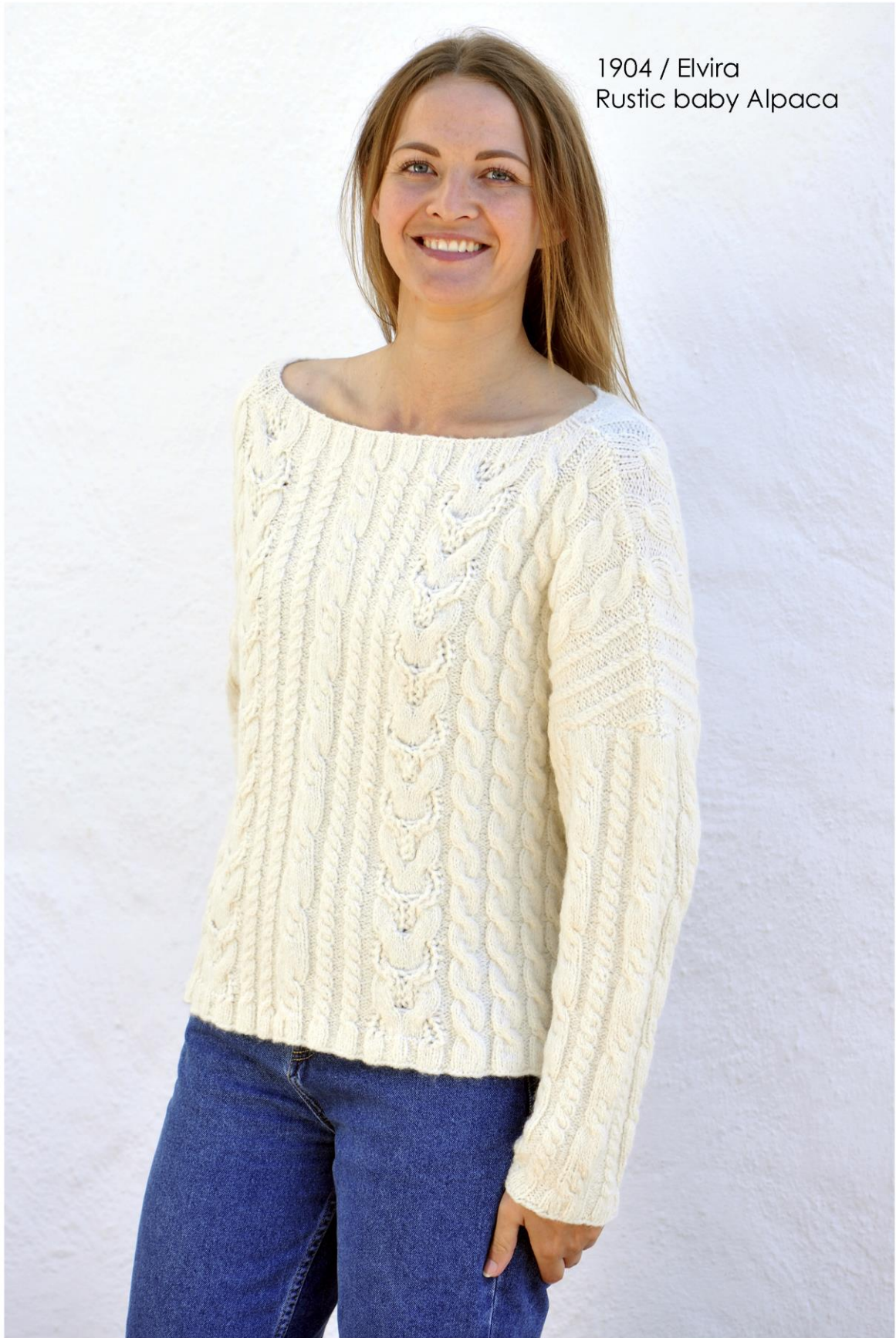
1904 / Elvira Rustic baby Alpaca